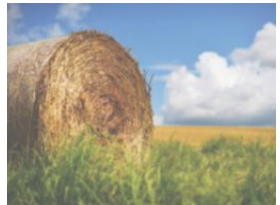
VARMERE: Kan gi lengre vekstsesong i landbruket.

28.4°C Sigdal - Nedre Eggedal 10.6°C Hemsedal li 0.4 mm Uvdal Kraftverk