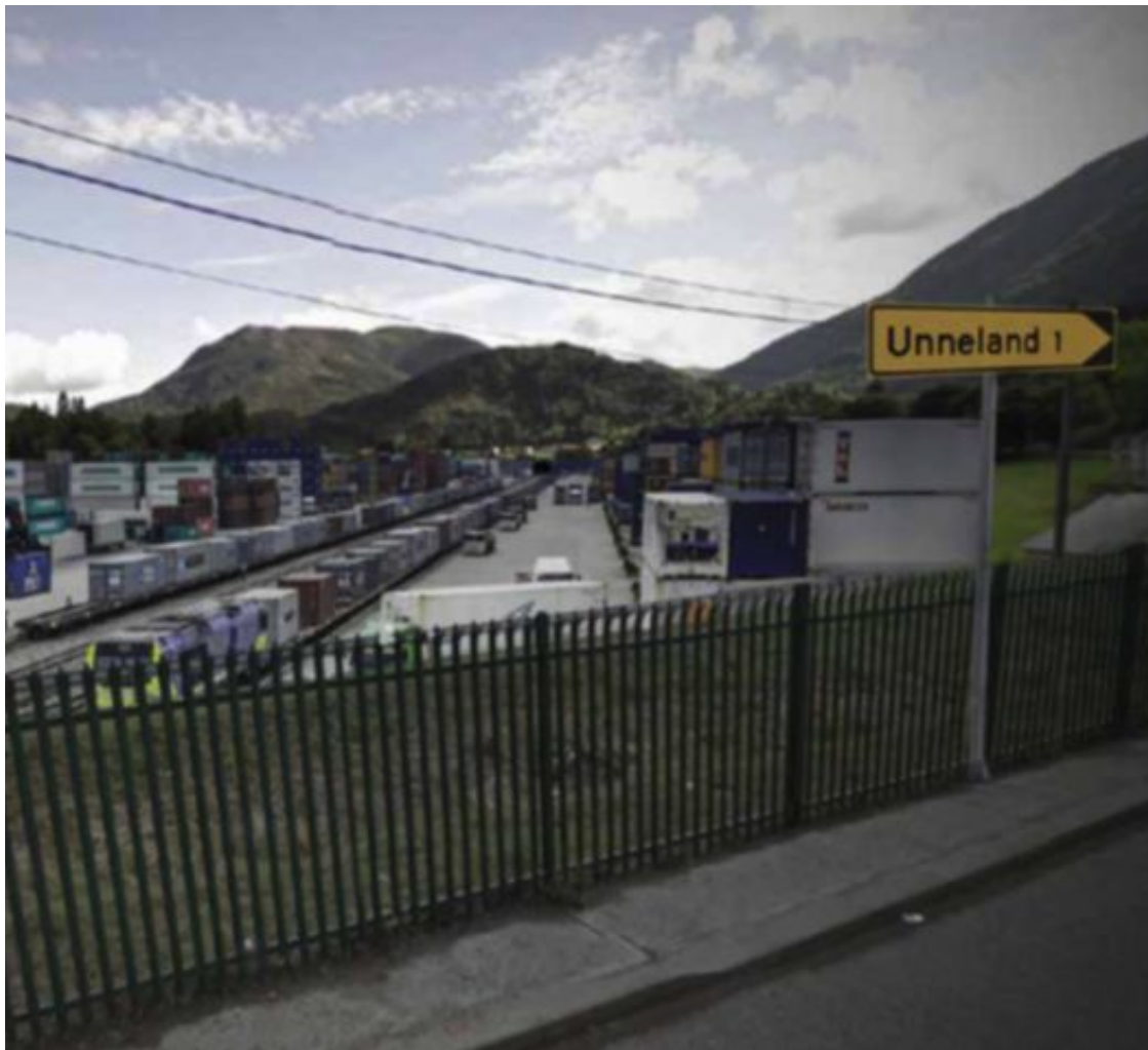
GODSTERMINAL: Aksjonsgruppen mot godsterminal har laget dette bildet for å vise hvordan de frykter at Unneland skal blir rasert ved en eventuell godsterminal her.