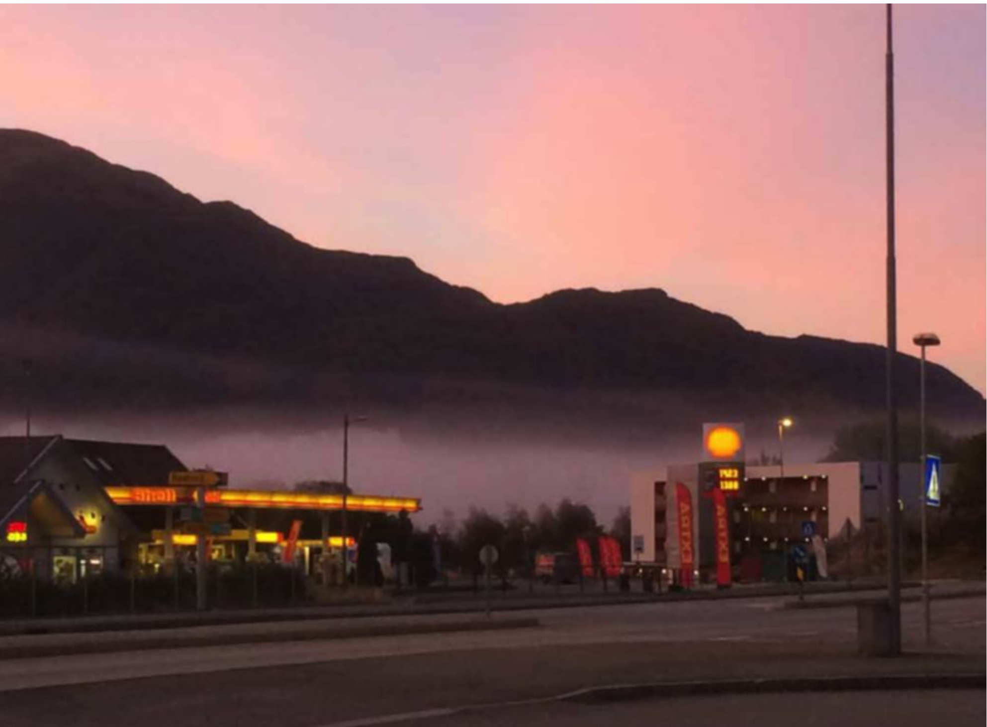
en, og viser hvordan tåken ligger over Haukelandsvannet.

En undersøkelse fra 1972 viste at det i perioden oktober-mars var i gjennomsnitt 46 dager med stillestående luft i bergensområdet, og man regner med at in-