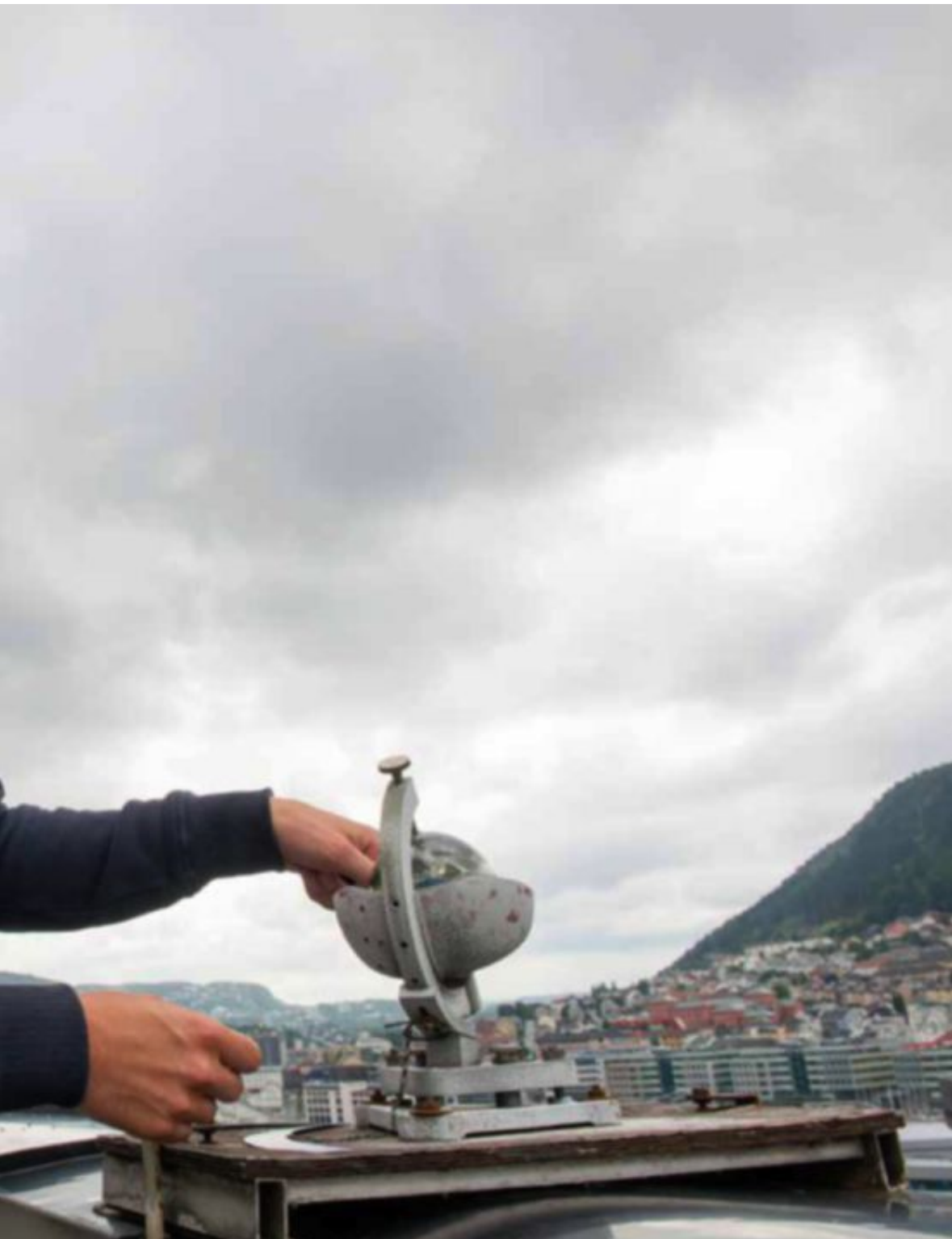
soltimer har vært målt i Bergen siden 1952.