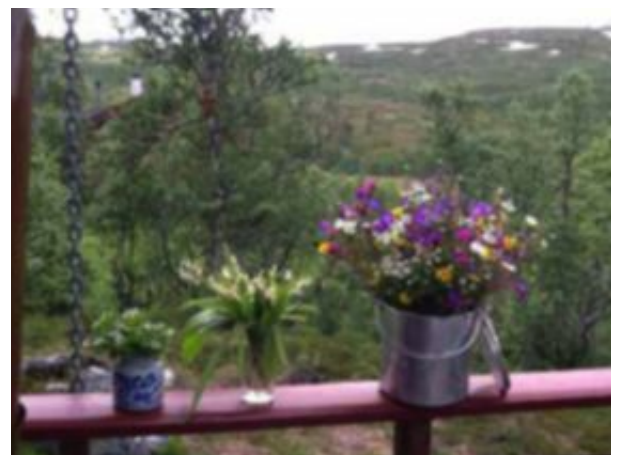
BLOMSTRENDE PÅ FJELLET: Midtsommer på Maurset.