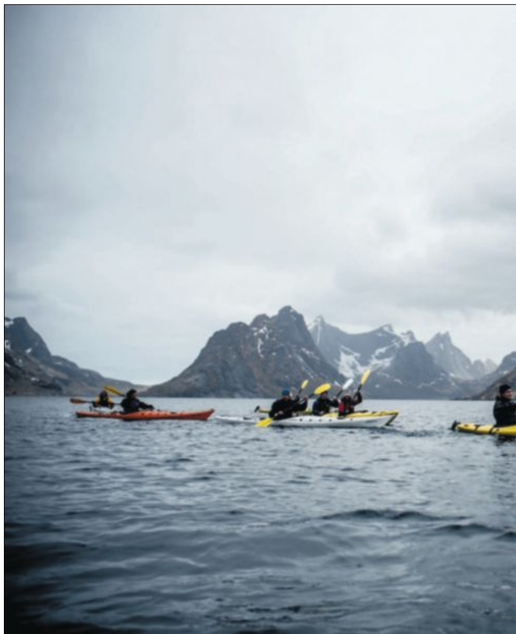
En undersøkelse gjort av bransjeorganisasjonen Destination Lofoten viste at 92 prosent av næringen ønsker verdensarvstatus for Lofoten.

– Ringvirkninger av petroleumsvirksomheten ser vi hver eneste dag – i hver eneste avkrok i dette landet. Det langsiktige perspektivet bør også være en del av denne debatten.