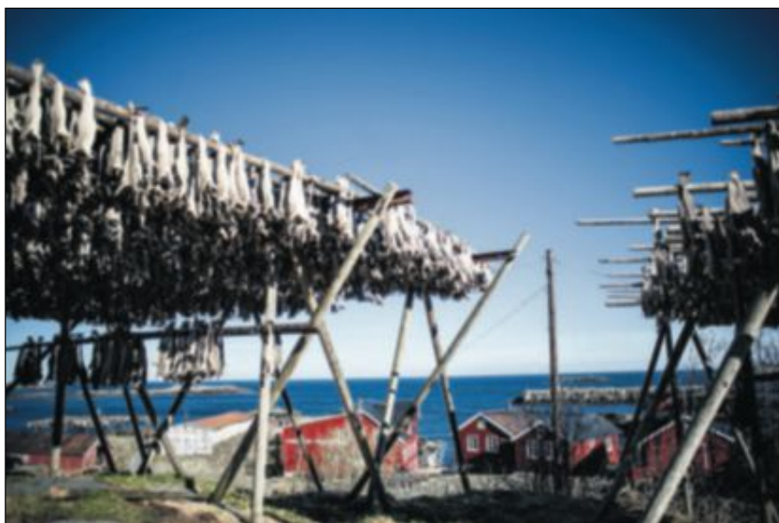
I flere hundre år var tørrfisk Norges viktigste eksportartikkel. I år ble torskervoten satt til rekordhøye 800 millioner kilo, som tilsvarer 2,5 milliarder måltider.

– Denne regionen har ikke ressurser til å utnytte de mulighetene som måtte komme. Det vil gå som i Sogn og Fjordane. Til tross for at alle de store oljefeltene ligger utenfor kysten i dette fylket,