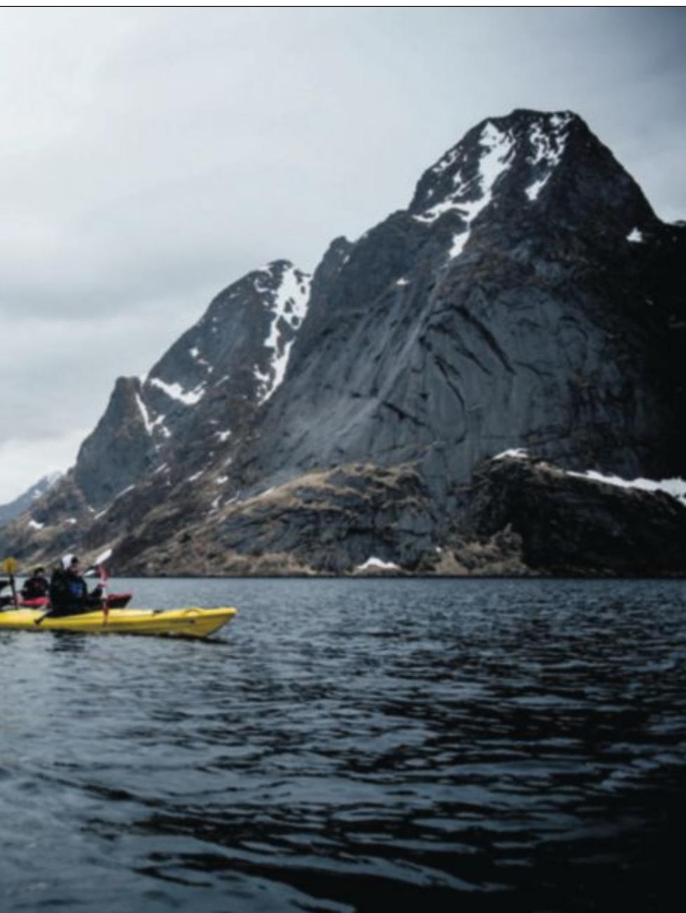
regionens reiselivsbedrifter er mot oljeboring. Undersøkelsen viste også at reiselivs-

oljeutslipp rett utenfor Lofoten og Vesterålen føre til at oljen blir transportert inn og ut av fjordene. Store kystområder kommer til å bli tilgriset.