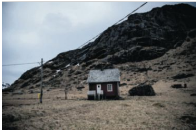
For ja-siden er fraflytting et av hovedargumentene for å slippe til oljeselskapene i Lofoten og Vesterålen.