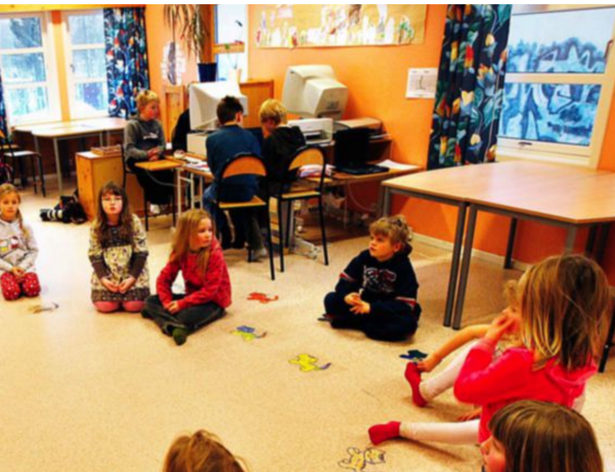
Utenlandske studenter oppfatter den norske skolen som inkluderende, skriver Per Bjørnar Grande. Bildet er fra Flesberg skole i Buskerud, der elevene synger en sang mot mobbing.