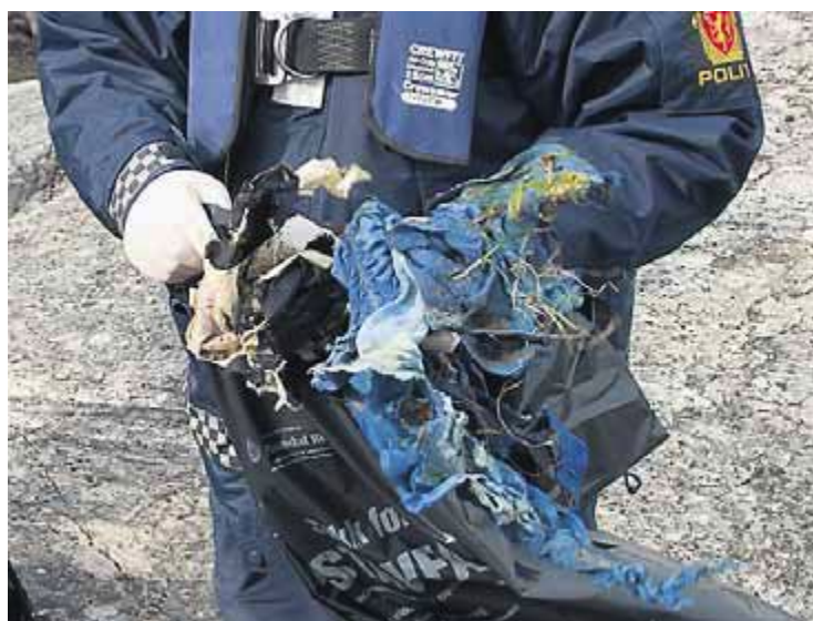
Klær: Disse restene av klær ble funnet i fjæresteinene – sammen med beinrester. Politiet vet ikke sikkert om klærne tilhører liket, eller om de har drevet i land på et annet tidspunkt.

Lensmannen tar oss med opp på berget, der hodeskallen ble funnet. Der ligger det nå fiskebein og krabberester.