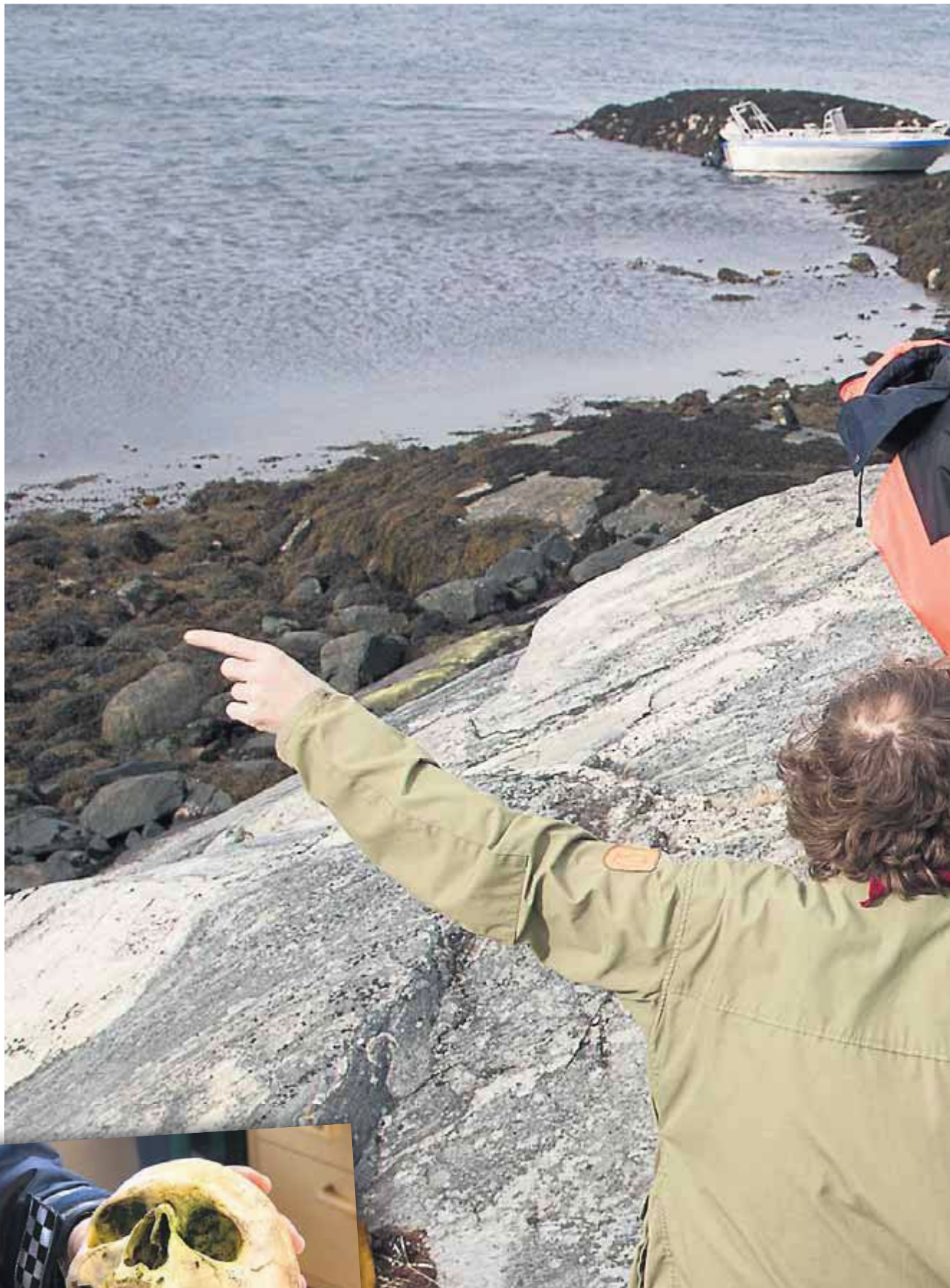
Funnstedet: Bildet er tatt i forbindelse med likfunnet på Halmøya i 2006: Et vitne