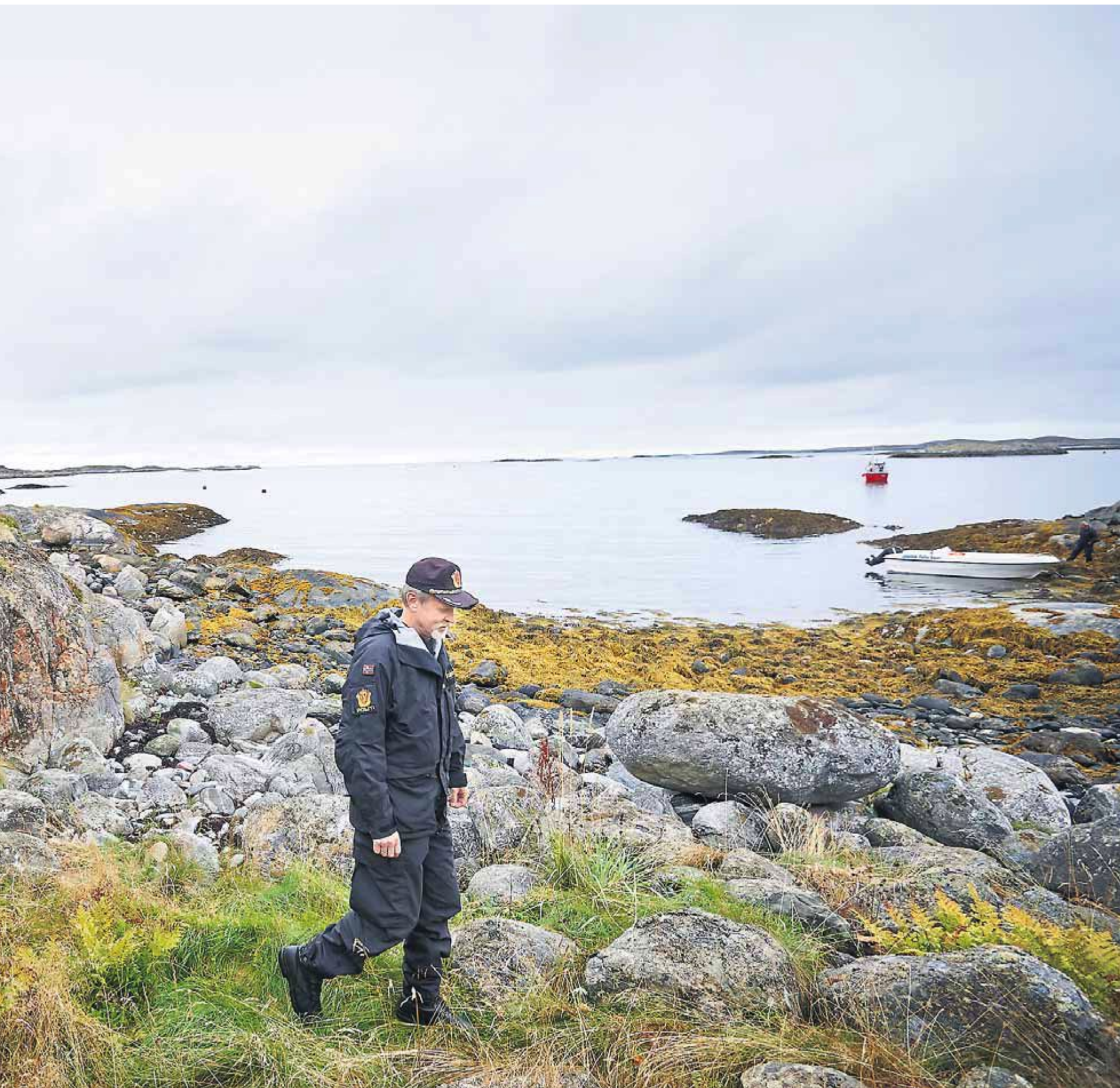
gått siden mannen ble funnet død i fjæra. Politiet trenger nye opplysninger for å kunne identifisere den avdøde.

i nærheten av liket? Kunne de gi en lede-tråd videre?