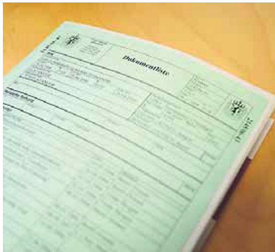
Mappa: Politiet gjorde undersøkelser av liket, og forsøkte å spore identiteten til mannen – uten å lykkes.

Frankrike eller Storbritannia. Kanskje også fra Østersjøen.