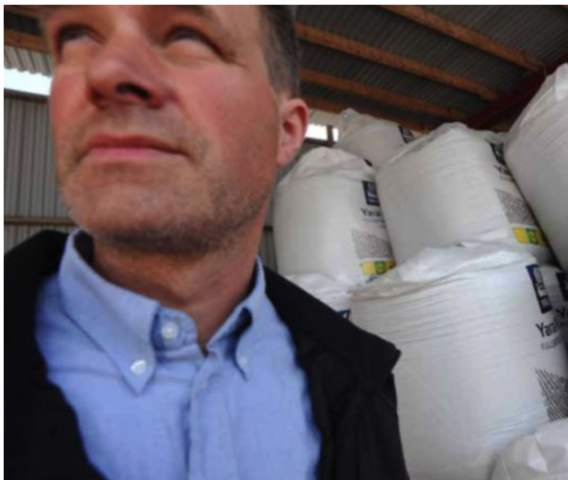
På vent: førebels står sekkane med kunstgjødsel pent oppstilte og ventar på betre tider.

å bli bonde ein dag. – Eg trur det kan vere fint, seier ho.