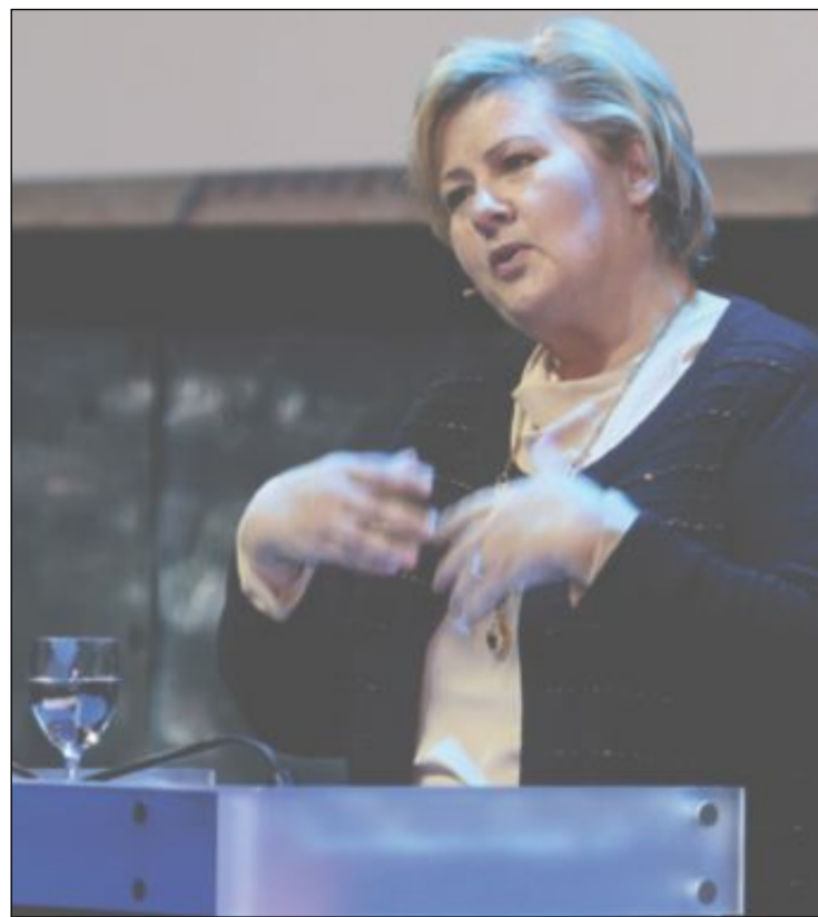
MER TIL UTVIKLING: Statsminister Erna Solberg lover å fortsette arbeidet med å fange og lagre CO2, og sier at det kommer mer penger i statsbudsjettet til utvikling av nye tiltak.