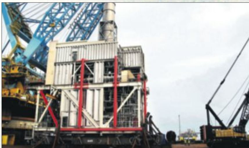
Ruver: Den 1.000 tonn tunge lavtrykkmodellen ruvet på dekket til «Saipem 7000». I bakgrunnen Kristin-plattformen, hvor modulen nå er trygt plassert.

1.522 yrkesaktive leger fikk tilsendt spørreskjema, svarprosenten var 67 prosent. (ANB-NTB)