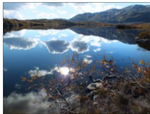
KVAMSKOGEN: Fjellvatnet blinket vakkert denne blikkstilte høstdagen i september.

Har du tatt et fint bilde, send det til leserbilder@bt.no eller som mobilfoto til 2211. Hver måned kårer vi en vinner som får flaxlodd i posten.