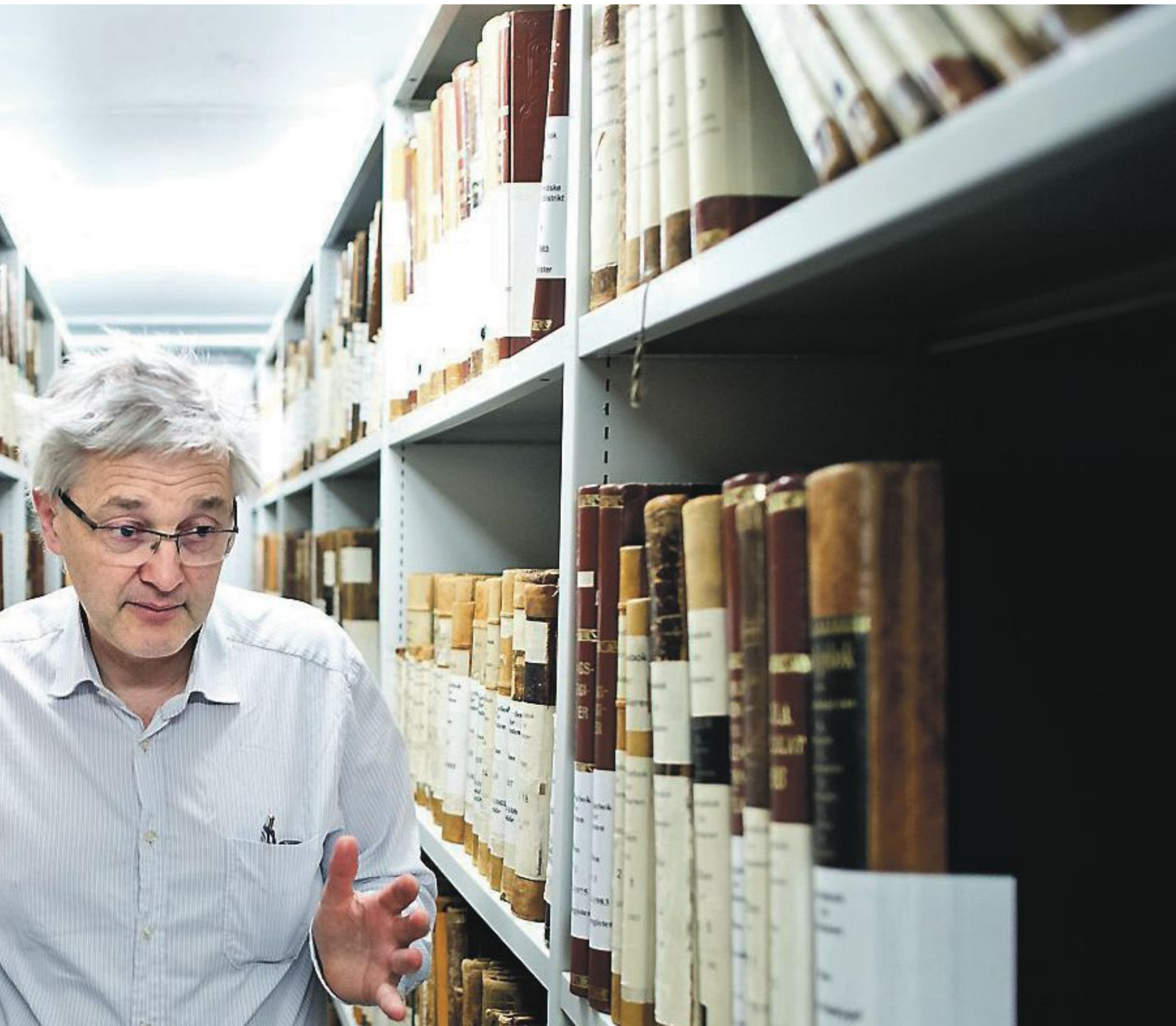
nd at man ikke skriver kirkebøker på denne måten lengre.

bare funnet den rette boken, men også slått opp på rett side.