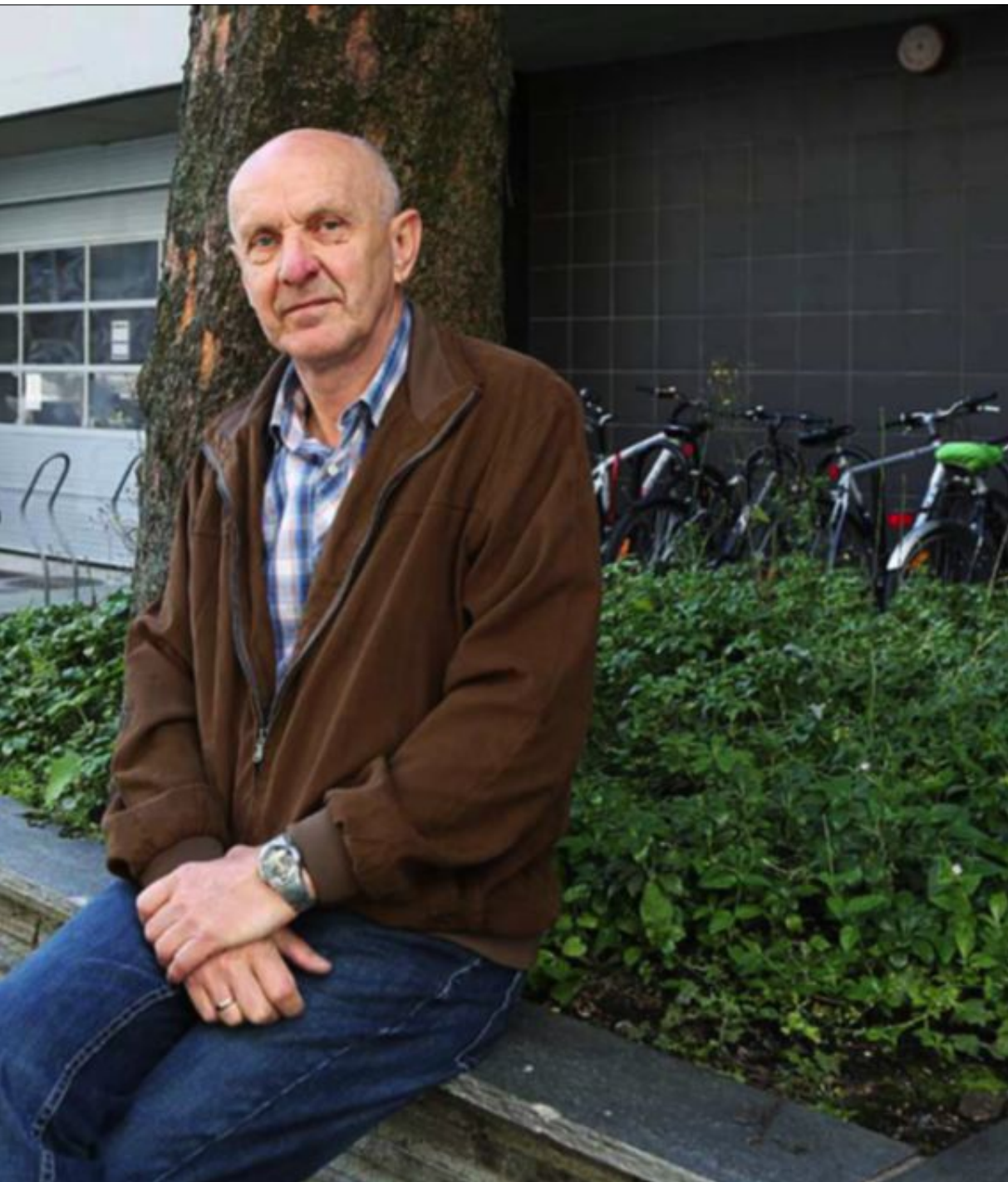
sporveiskollegene den lange bussturen til Krakow i Polen.