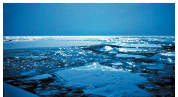
Smelter: Havisen i Arktis er allerede i ferd med å forsvinne. Mot slutten av århundret kan temperaturen i området være så mye som ti grader høyere.