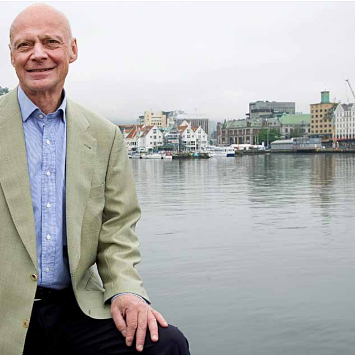
Dreggen. Bildet er tatt på Dreggens sørligste utpost – Dreggekaien.

annet fast fanebærer på Drægens stiftelsesdag.