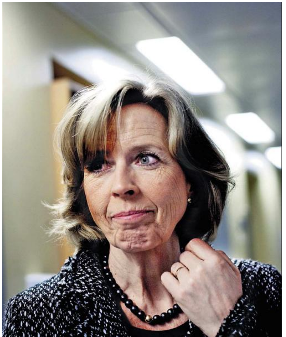
FÅR KRITIKK: Helseminister Anne-Grete Strøm-Erichsen får høre det av opposisjonen.