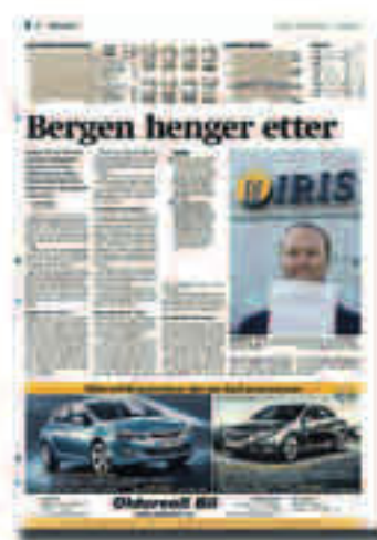
16. SEPTEMBER: En undersøkelse viser at Bergen har den laveste andelen nyskapende bedrifter av de fem største byene i Norge. Bergensbedriftene har også minst internasjonalt samarbeid.