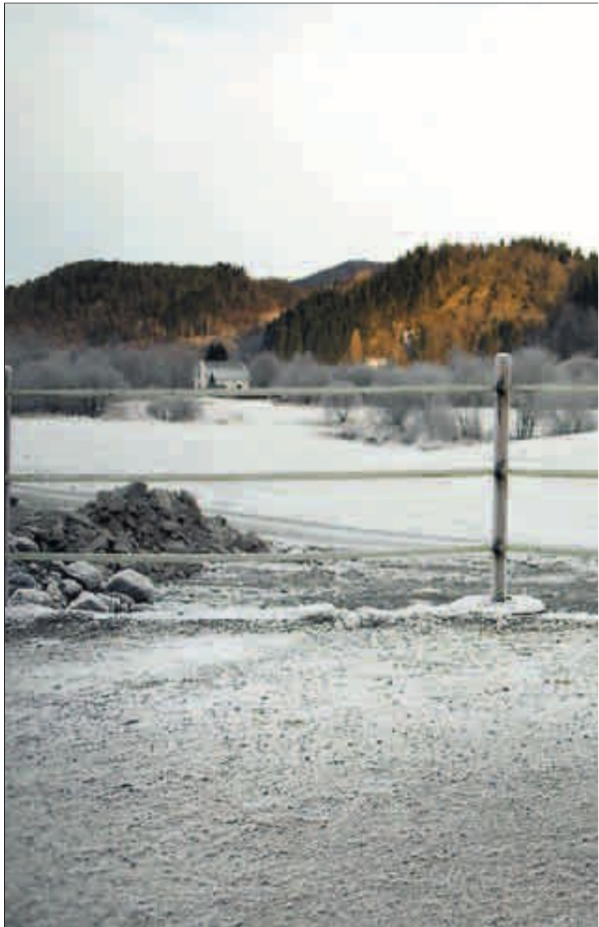
ISKALDT PÅ HAUGLAND: – Det er ikkje det at eg er så oppteken av vëret, men eg er livredd konsekvensen av tretti minus.

Då vi kom til Mindemyren, skein sola, og det var seks minusgrader. Tilbake i sentrum klokka eitt hadde tempen stige nokre hakk, til minus 2,9.