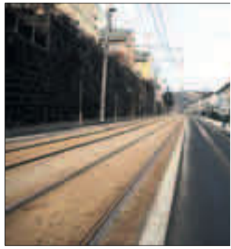
MINUS 4,9: Minde klokka 11.00.