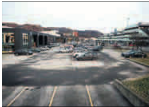
MINUS 7: Åsane senter klokka 09.50.