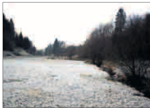
MINUS 7,2: Sælenvatnet klokka 11.00.