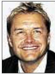
Dag Otto Lauritzen, tidligere proffsyklist