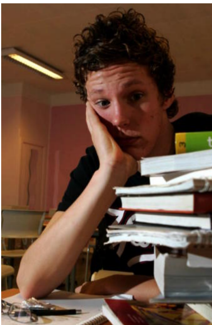
For den neste regjeringen vil det være et mål å få flere elever til å fullføre videregående skole.