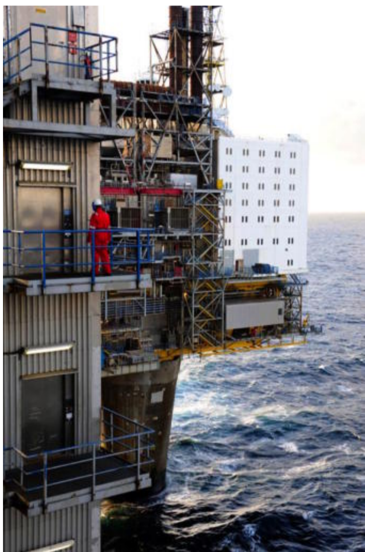
Norske politikere har ført en restriktiv politikk for bruk av oljefond. Vil handlingsregelen bestå?