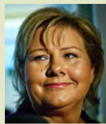
Høyres leder Erna Solberg får toppscore etter årets valgkamp.