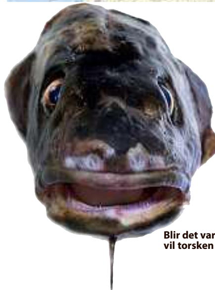
Blir det varmere i Norge, vil torsken trekke nordover.